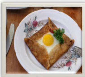
Les crêpes de Bretagne