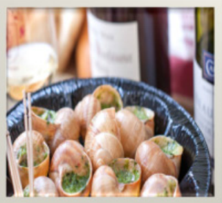
Escargots de Bourgogne