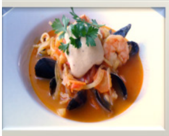
Bouillabaisse »Provence -Marseille