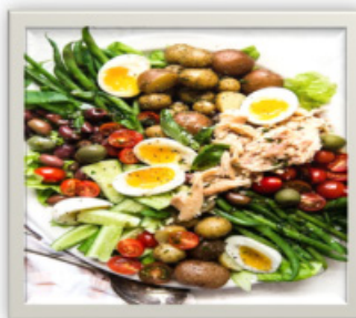
Une salade niçoise