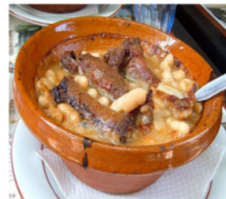
Cassoulet: Languedoc – Roussillon